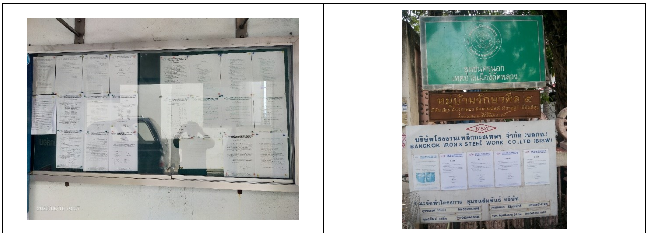
บอร์ดประชาสัมพันธ์ข้อมูลข่าวสารต่างๆ