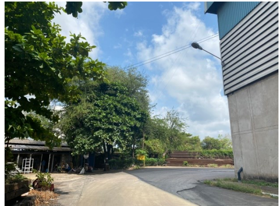
พื้นที่สีเขียว