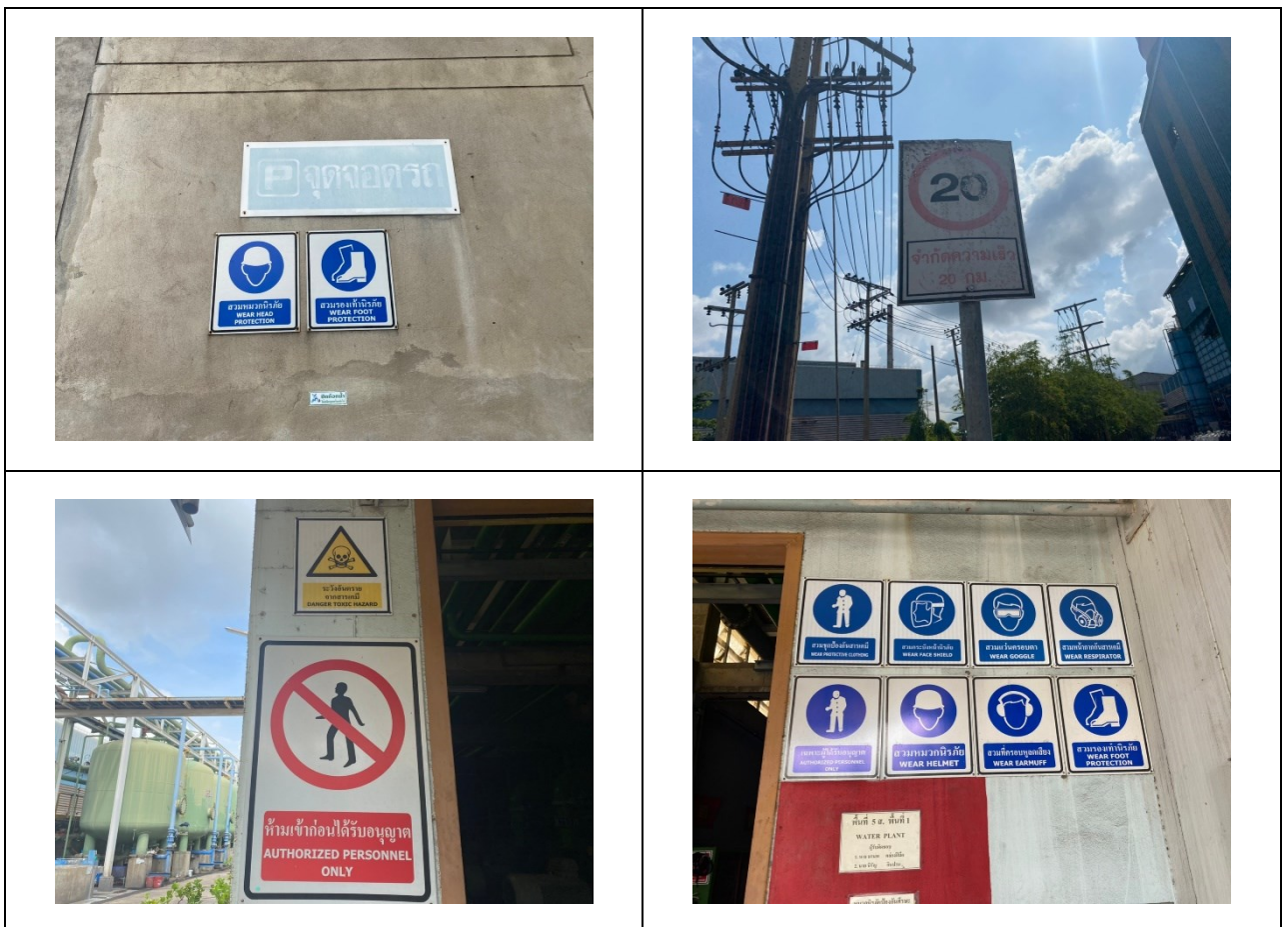
ป้ายสัญลักษณ์ต่าง ๆ ภายในโครงการ