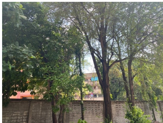
รั้วคอนกรีตล้อมรอบโครงการ