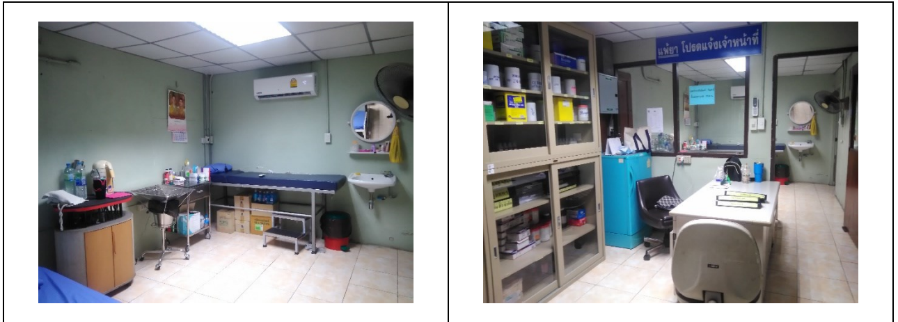
อุปกรณ์ปฐมพยาบาลเบื้องต้น