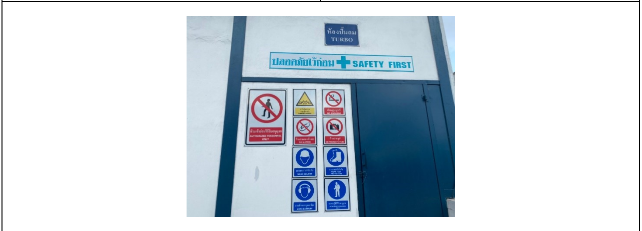
ป้ายสัญลักษณ์ต่าง ๆ ภายในโครงการ (ต่อ)