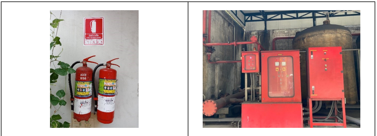
อุปกรณ์ป้องกันอัคคีภัย