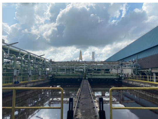
บ่อน้ำขนาด 2,000 ลิตรพร้อม Settling Cyclone