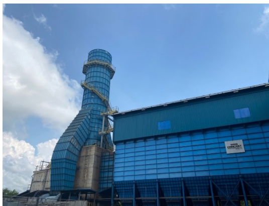
ปล่องเตาหลอมใหม่ (EAF)